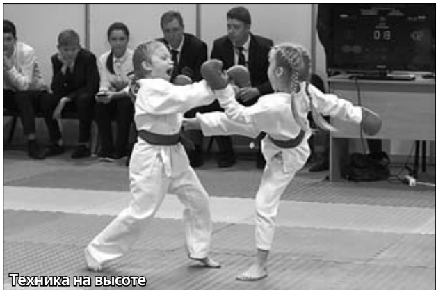
Техника на высоте